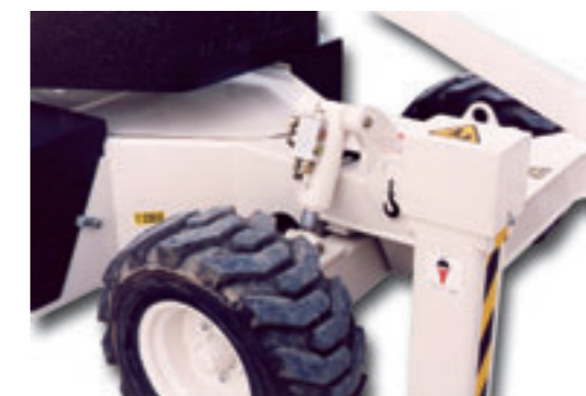
③ * Oscillant axle.