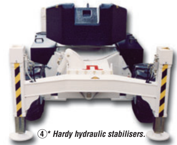
④ * Hardy hydraulic stabilisers.

The articulations are mounted with hardened and ground steel bolts, which rotate on bushings lubricated caps with greasers. Specially designed to work in uneven grounds, thanks to its exclusive leveling system.