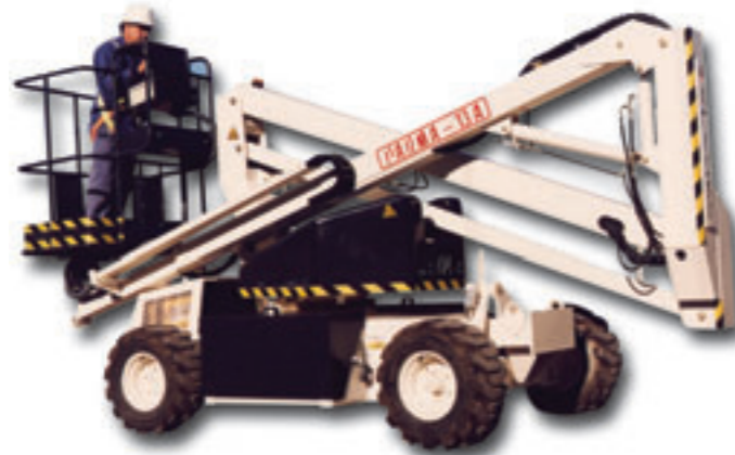
① * Standard version without hydraulic stabilisers.

This model is also available with an independent hydraulic system to operate under the tough conditions where other machines cannot work. Its equipped with two articulated booms (one also telescopic) giving an outreach of 6,2 meters until 7 meters high. Perfectly suitable for extremely tough conditions.