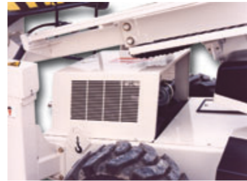
⑥ * Electric motor shielded and refrigerated.