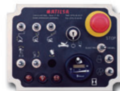
② * Lower control box.