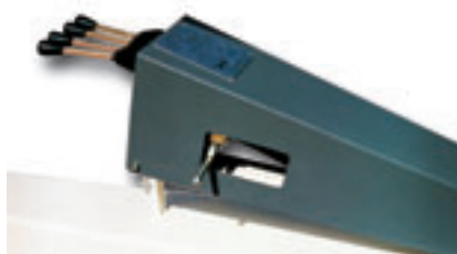
③ * Controls for hydraulic stabilisation.