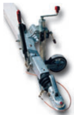
② * Inertia coupling brake.