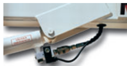
① * Anti-return valves.